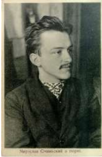
Мирослав Січинський з горня.

Але цей осуд підживив неприхильне ставлення українців до польського панування в Галичині та поміркованої позиції деяких українських політичних кіл. Широкий загал українського громадянства підтримав М. Січинського. Народ по селах співав: «Наш Січинський най жиє, а Потоцький най гниє!», дітям масово почали давати ім'я Мирослав. Водночас після 12 квітня містами Галичини прокотилася хвиля антиукраїнських погромів.