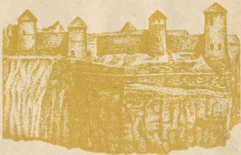
Так виглядала Старозбараська фортеця, зруйнована ординцями в 1589 році.

ми Водами і Корсуном долинула до Збаража. Сотні селян подалися під знамена повстанців. Завдавши ворогам нищівного удару під Пилявцями, селянсько-козацькі загони Максима Кривоноса у 1648 році підступили до Збаража і захопили фортецю. Забравши гармати, провізію, Кривоніс рушив до Львова на з'єднання з військом Богдана Хмельницького.