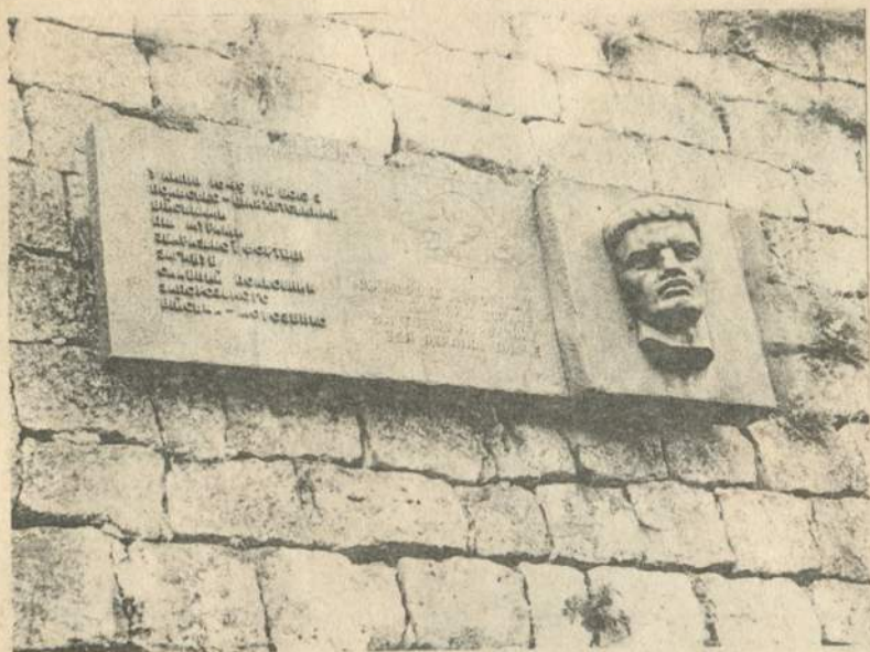
Меморіальна дошка на мурі Збарзької фортеці на честь козацького полковника Морозенка.

Пам'ятник Богдану Хмельницькому у Збаражі.