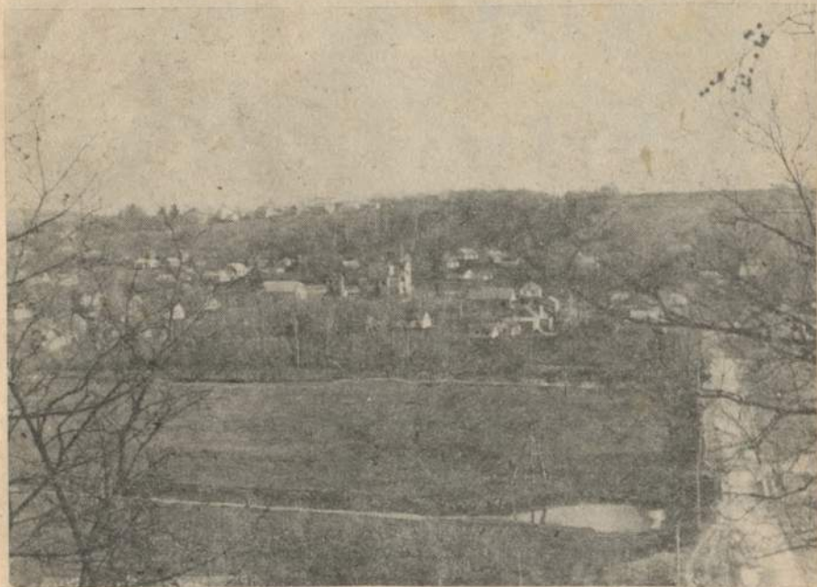
У верховітті Горни, на невисоких пагорбах та в широкій зеленій долині розкинулося давнє українське містечко Вишнівець.

Князь Дмитро Іванович Вишневецький, «справжній козак за