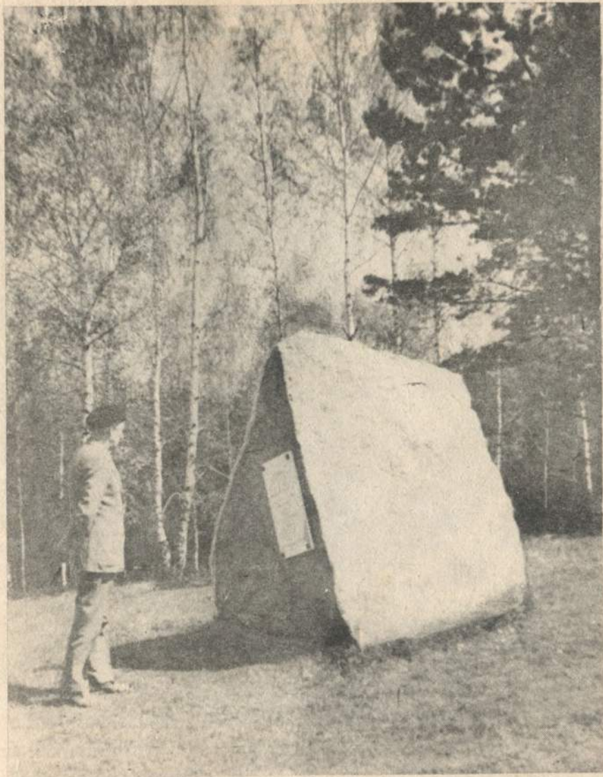
Державна палеонтологічна пам'ятка природи. Місце знахідки решток мамонта.