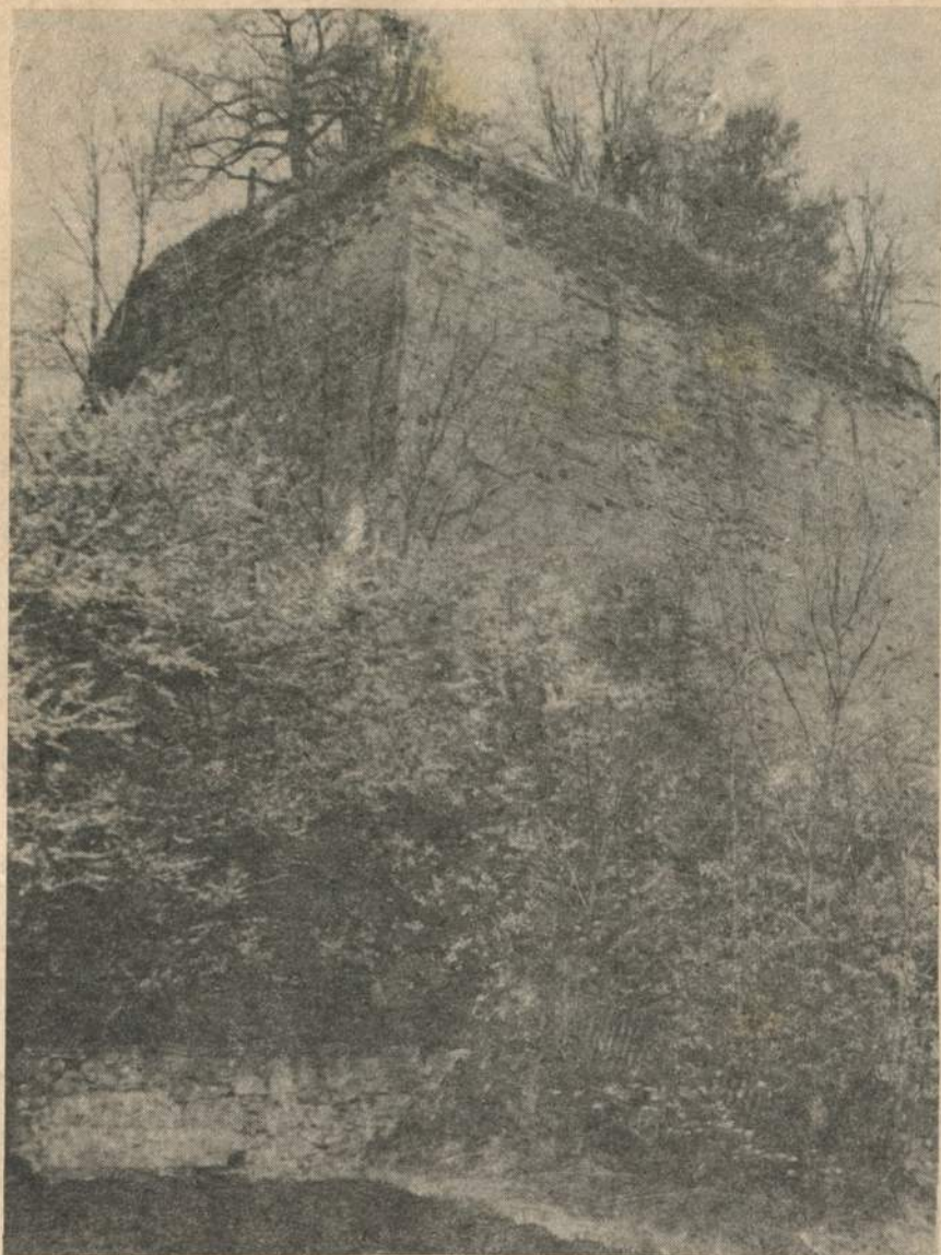
Південний бастіон Вишнівецької фортеці.