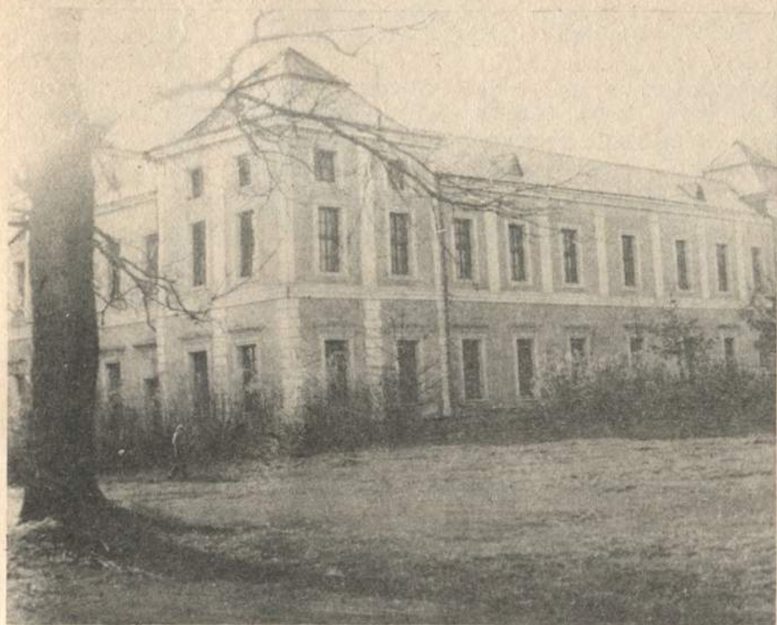
Палац Вишневецьких — пам'ятка архітектури XVIII ст.

древніх рукописів, рідкісних книг. Зберігалися тут рукописи і книги з місцевої історії, хроніка роду Вишневецьких. Дуже цінними були оригінали листів магнатів, королів, царів. Усе це збирав книголюб і вчений князь Михайло Юрій Мнішек. Тяжка доля судилася бібліотеці. У 1876 році її купив граф Толль і в 1920 році вивіз її до Києва, де тримав у підвалі. Одного разу труба лопнула, і вода з каналізаційних труб залила всю бібліотеку. Вдалося врятувати тільки дещо.