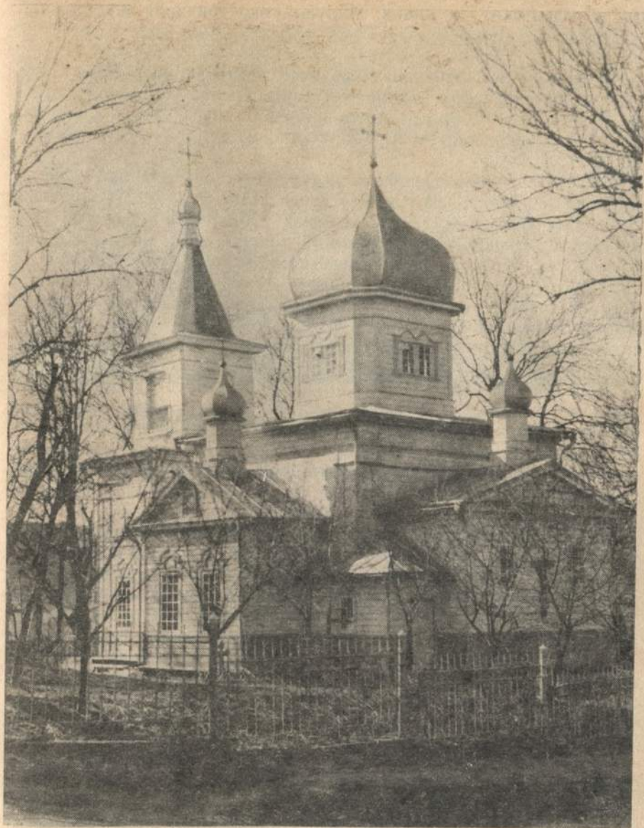
Церква Різдва Христового у Старому Виснівці, пам'ятка архітектури ХІХ ст.