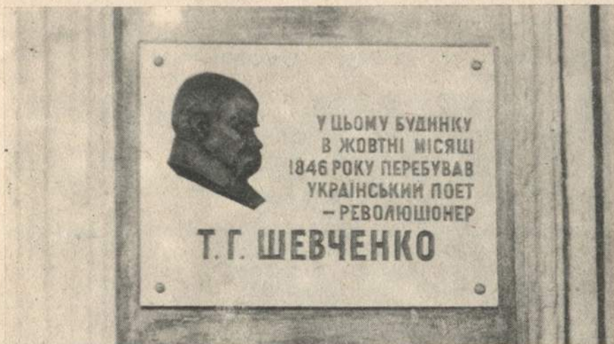
Меморіальна дошка Т. Г. Шевченкові при вході до палацу Вишневецьких.