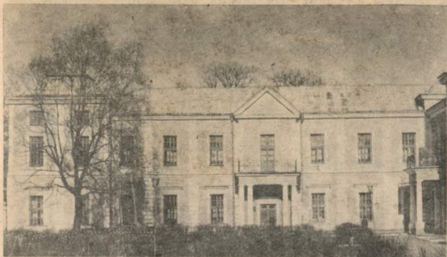
У 1963 — 1970 роках Вишнівецький замок відбудовано.

захоплюються його повістями «Облава», «Неслава» та іншими, повістю-легендою «Морозенко», численними оповіданнями.