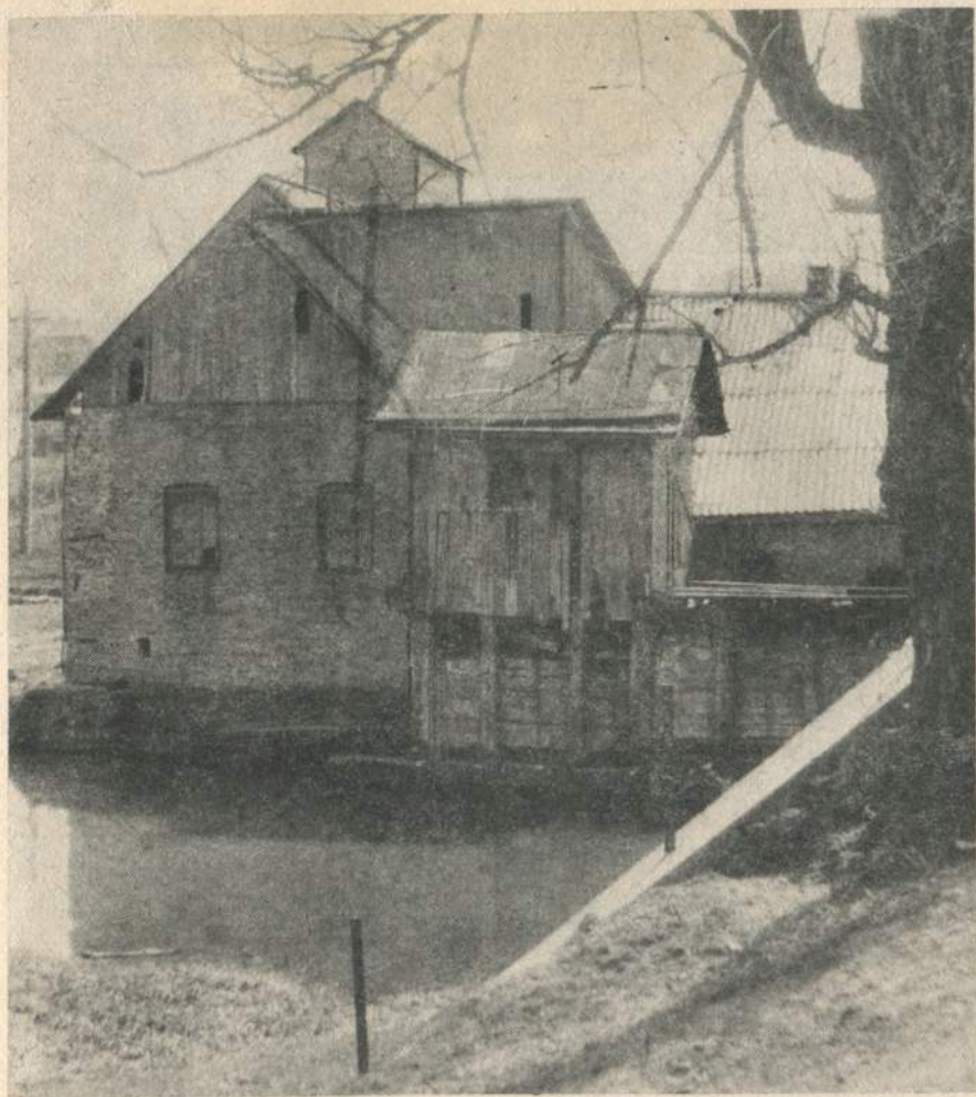
Водяний млин на Горині у Вишнівці. Пам'ятка архітектури місцевого значення.