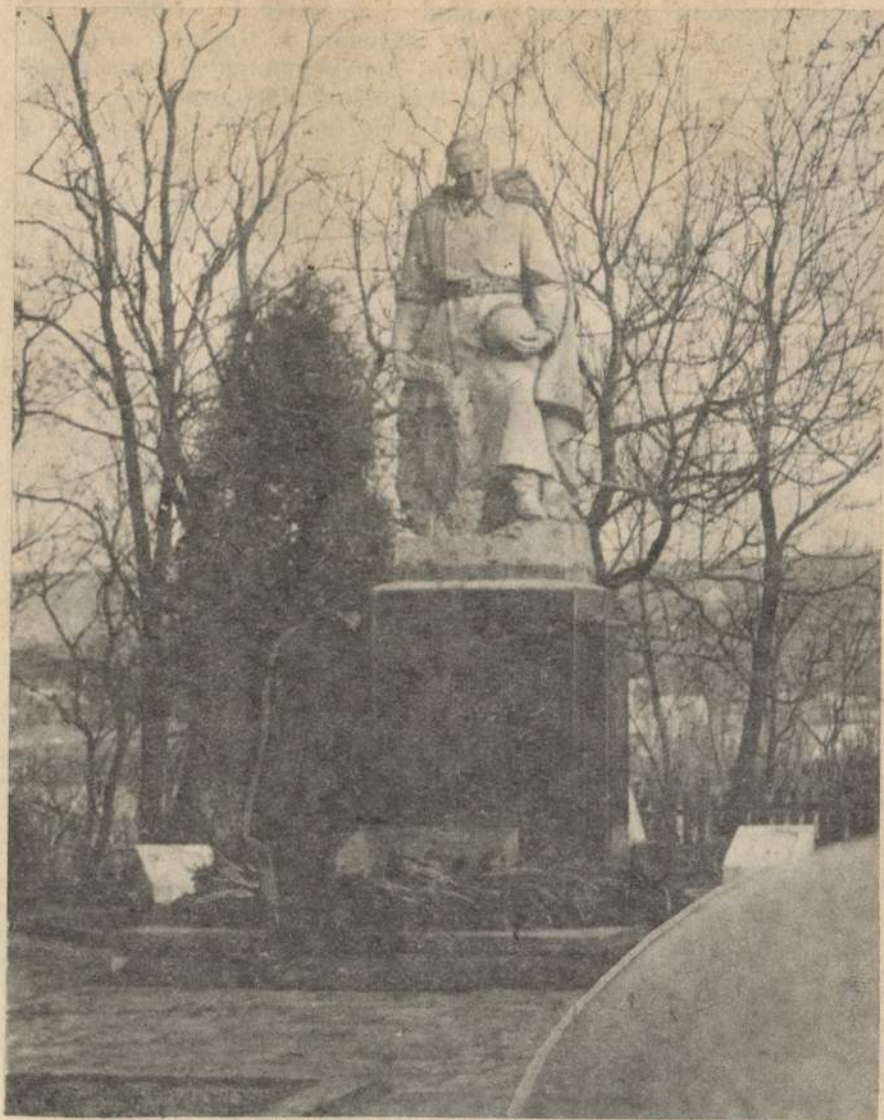
Пам'ятник радянським воїнам, які визволяли Вишнівець від фашистських загарбників у березні 1944 року.