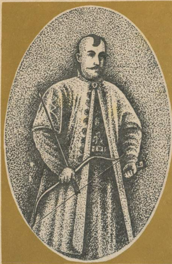
Дмитро Вишневецький [Байда], легендарний герой, оспіваний у народних піснях і переказах.

натурою і знаменитий вождь свого часу», нащадок волинських князів Гедиміновичів, православної віри. Був власником багатьох маєтків у Кременецькому повіті, зокрема Вишнівця, Підгайців, Вікнин, Таража, Комарища, Крутнева, Лопушна.