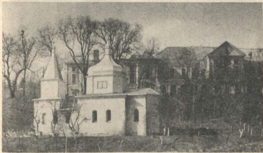
Призамкова Вознесенська церква, усипальниця князів Вишневецьких — пам'ятка історії і архітектури.