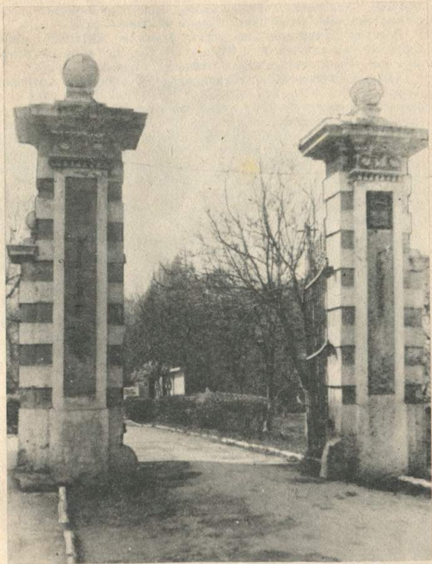
В'їзна брама до палацу Вишневецьких — Міншкєв.