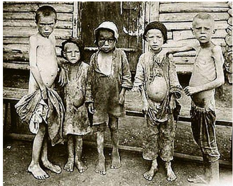
Жахливі «женива» Голодомору 32-33 рр.

Оцінки кількості загиблих внаслідок Голодомору 1932-1933 років коливаються від 3 до 7 мільйонів жертв. Називаються й більші цифри. Радянський Союз намагався приховати правду про геноцид. У роки Голодомору західні уряди, прагнучи не погіршувати відносини з СРСР, воліли мовчати. Після Другої світової війни на міжнародному рівні було