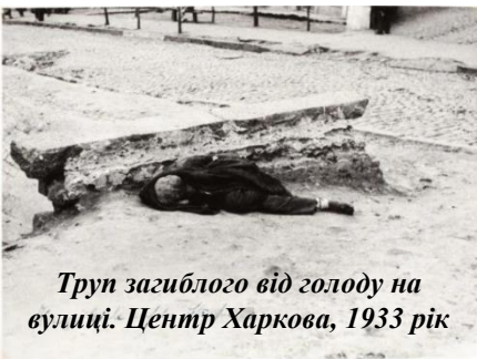
Труп загиблого від голоду на вулиці. Центр Харкова, 1933 рік

Цього року ми знову вшануватимемо жертв сталінського геноциду в умовах повномасштабної війни Росії проти України. Через дев'ять десятиліть після Голодомору-геноциду проти українців знову застосовують геноцидні практики.